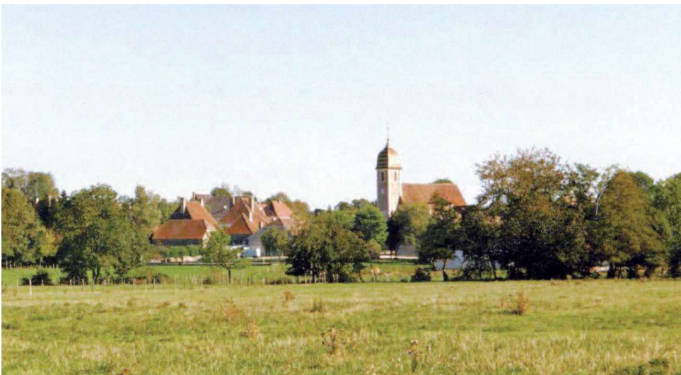
Rahon (Jura) - Église de l'Assomption 1. Vue générale sur le village

Cette église, consacrée à Notre-Dame de l'Assomption, est construite en briques roses, avec encadrements en pierre blanche. Bien que l'ensemble soit assez homogène, il apparaît cependant que des éléments de la précédente construction, notamment les travées orientales de la nef, pourraient dater du XV e s., tandis que le clocher a remplacé, au début du XIX e s., un clocher plus ancien.